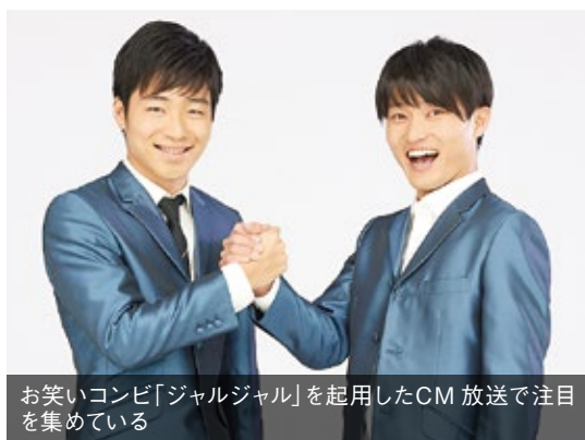
お笑いコンビ「ジャルジャル」を起用したCM放送で注目を集めている

なぜこれほどの短期間で急成長を遂げることができるのか。まず同社では、物件の選定から資金調達、後の管理までを一括してコンサルディングしている。そのため、オーナーの手間を省いた不動産経